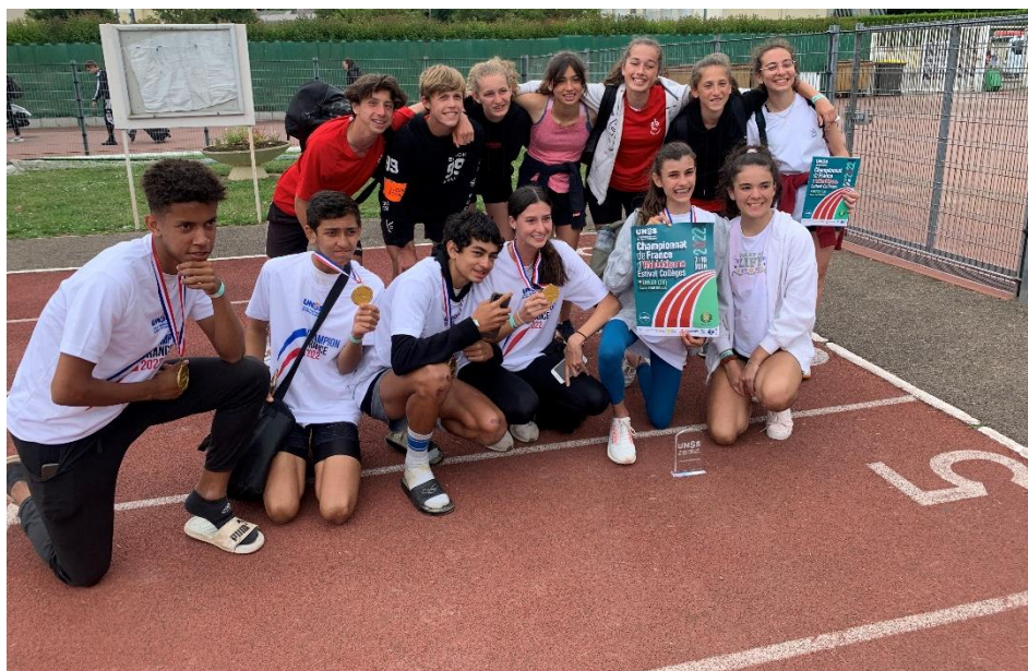
Les repas au Lycée Rotrou